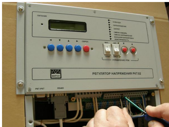
Рис 2: Метод монтажа